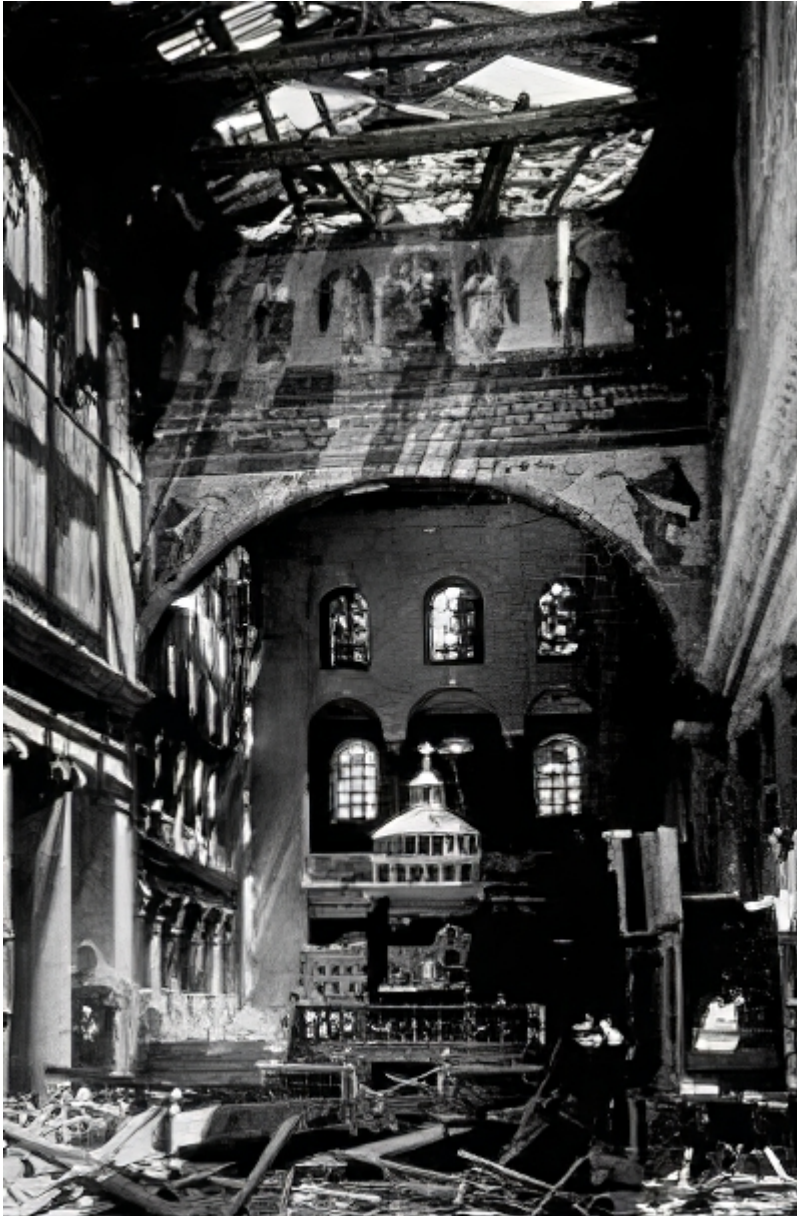
La Basilica Romana di San Lorenzo Fuori le Mura