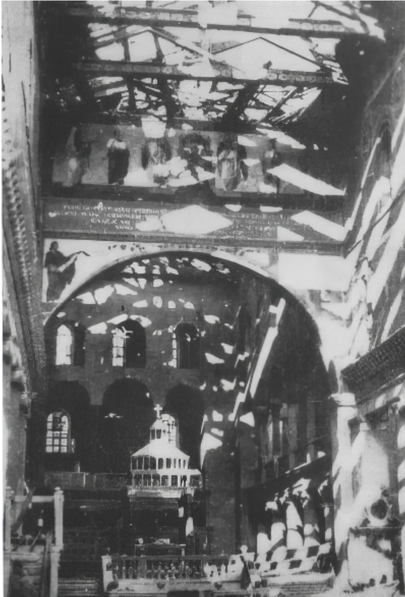
La presunta Chiesa della Maddalena a Foggia