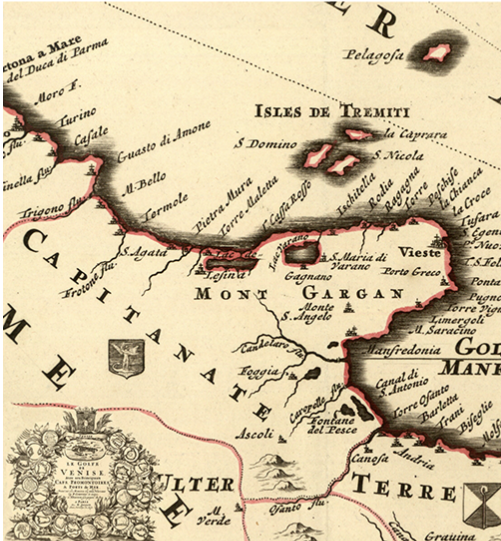
Carta Sanson - Il particolare della Capitanata

LE PUNTATE PRECEDENTI DI MEMORIE MERIDIANE