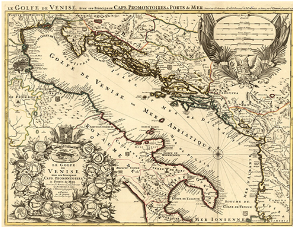
Carta Sanson - Il Golfo di Venezia

Potete scaricare in alta risoluzione ai link qui sotto la carta intera, e il particolare che riguarda la provincia di Foggia. Più giù, i collegamenti alle precedenti puntate di Memorie Meridiane .