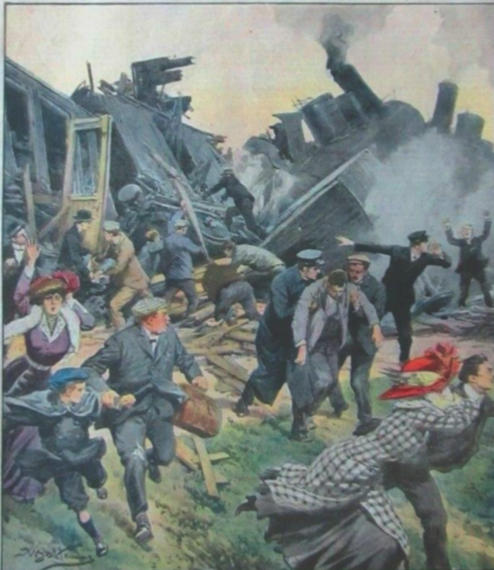
Grave disastro ferroviario sulla linea Foggia-Bari: la ricerca dei morti e dei feriti.

Si pubblica a Milano ogni Domenica Supplemento illustrato del "Corriere della Sera" MILANO 16-23 Gennaio 1910. Costo del numero.