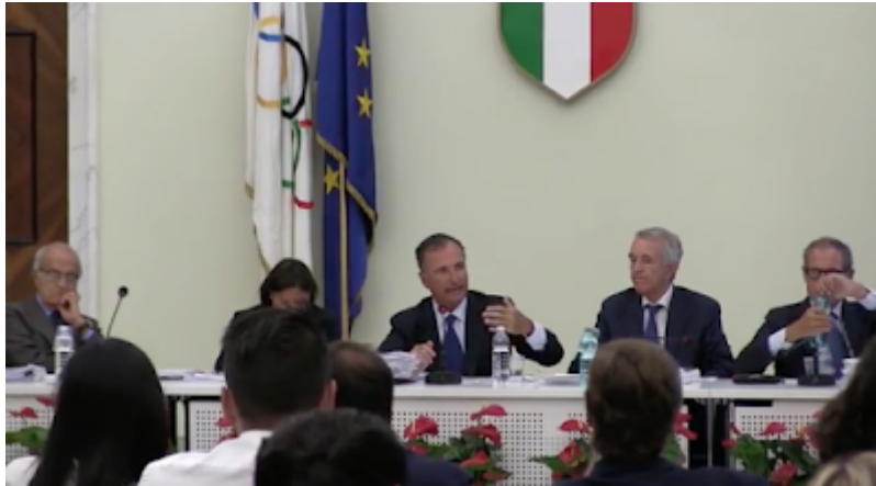
Il collegio di garanzia del Coni

Il calcio italiano sta diventando sempre di più una farsa. Le maggiori testate sportive questo pomeriggio hanno diffuso la notizia della sospensione del torneo di serie B, dopo le dichiarazioni del presidente del Collegio di Garanzia del Coni, Franco Frattini che partecipando ad una trasmissione sportiva dell'emittente Umbria Tv aveva chiarito gli scenari del campionato di Serie B dopo l'ufficializzazione della data dell'udienza (venerdì 21 settembre prossimo, alle 14.30) in cui il Collegio si pronuncerà in via definitiva sulla composizione del campionato (se con il format attuale, a 19 squadre, oppure a 22).