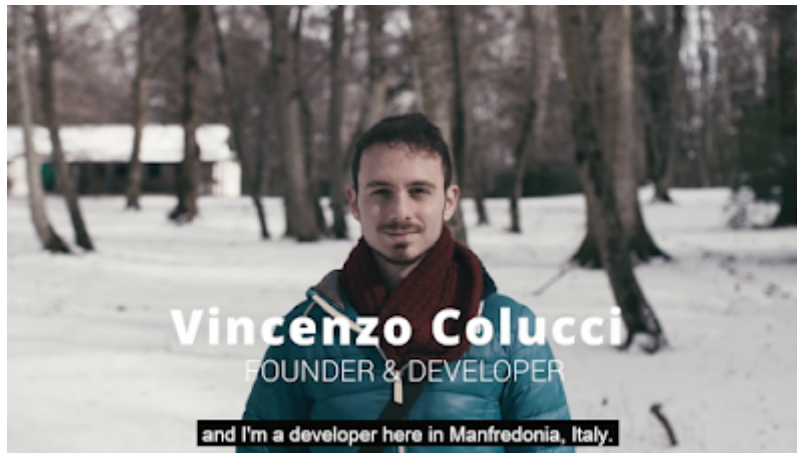
L'immagine con cui Google ha reso omaggio a Colucci