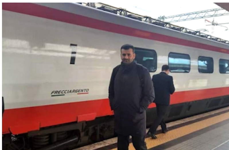
Il sindaco di Bari, Antonio Decaro

Cari baresi e caro Antonio Decaro, sindaco di Bari, ma è valsa veramente la pena offendere i foggiani, rivendicando a tutti i costi un treno diretto per Roma, che non ferma a Foggia? Forse il gioco non è valso la candela.