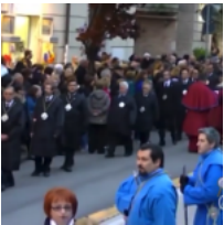
Pasqua a Foggia e in Capitanata