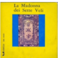
Ritrovata un'antica canzone sulla Madonna dei Sette Veli