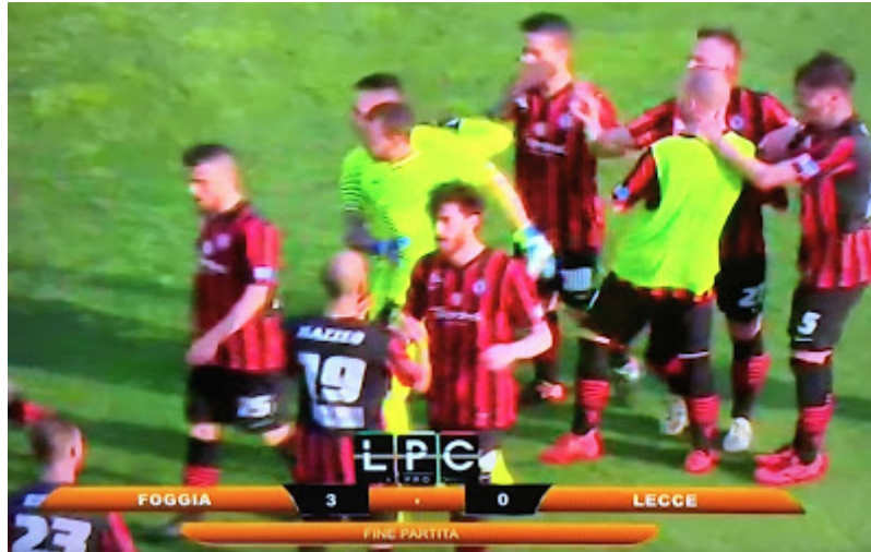
La festa dei giocatori del Foggia