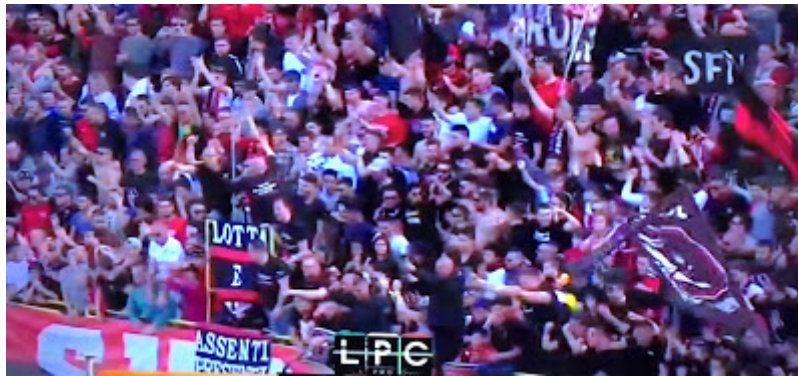
La festa dei tifosi