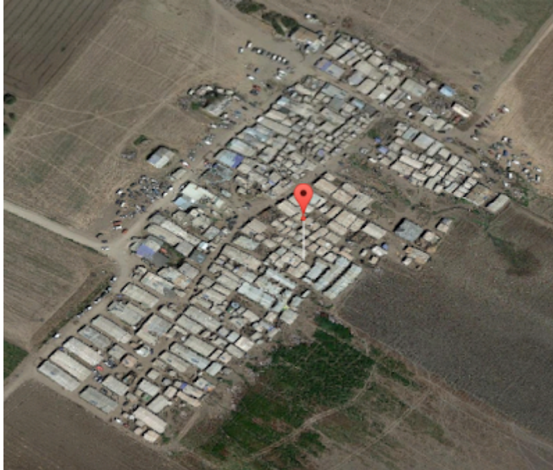
Il Grand Ghetto prima di essere sgomberato e bonificato

Fino a ieri pensavo si trattasse di sciatteria. Oggi non più. È protervia. Intollerabile supponenza di chi sbaglia sapendo di sbagliare e mente sapendo di mentire, ma è troppo pigro o troppo arrogante per ammetterlo.