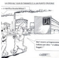
Che significa ArcelorMittal