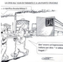
Che significa ArcelorMittal