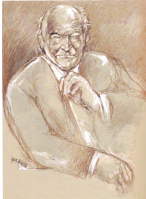
Ritratto ungarettiano di Giuseppe Bacci

Ecco la seconda ed ultima puntata dell'articolo saggio di Luigi Paglia sul Parco letterario dedicato al poeta Giuseppe Ungaretti che avrebbe potuto essere realizzato a Foggia e in Capitanata, nelle diverse località toccate dal viaggio sentimentale nelle terre daune, compiuto dal grande poeta nella primavera del 1934.