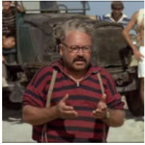
• Quella prima foggiana di Paolo Villaggio