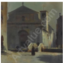
• A church in Foggia: il giallo del dipinto di Edward Seago