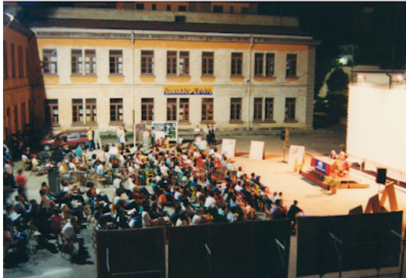
L'affollata platea di San Marco in Lamis

modello inglese. Un'esperienza che in realtà non diede molti frutti, pur potendo annoverare esponenti di grande spessore e autorevolezza come lo stesso Scola, designato ministro ombra della cultura.